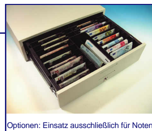
Optionen: Einsatz ausschließlich für Noten