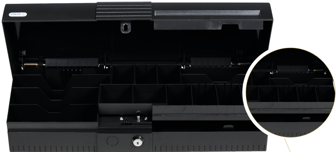
Kassette mit 9 Münzfächern