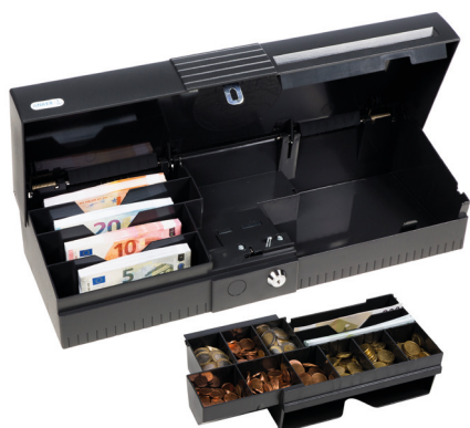
Individuelle Bestückung mit Münzfächern