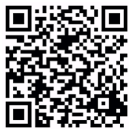
V110 3D Demo